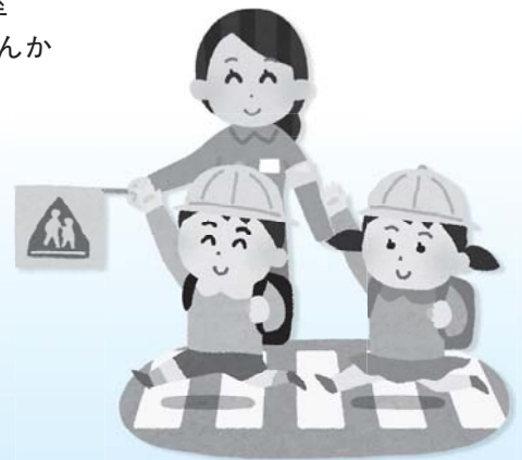
小学生の登下校時見守り