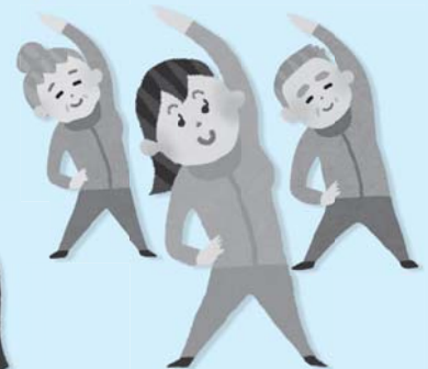
地域の集まり等に介護予防指導