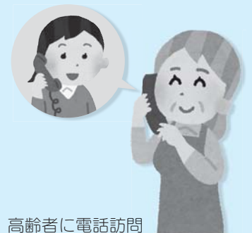
高齢者に電話訪問