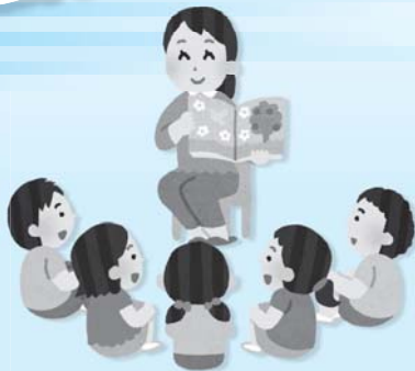
図書館や小学校での読み聞かせ