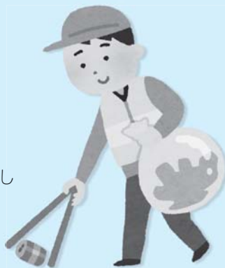
施設慰問・環境美化