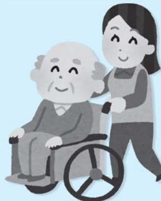
東陽病院長院者の手伝い