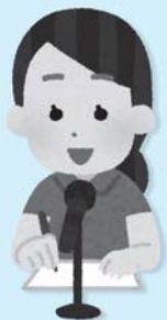
町広報紙をCDに録音し 希望者へお届け