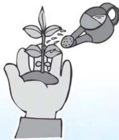
育てよう福祉の芽