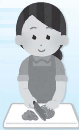
行事協力(食事作り、運営の手伝いなど) 地域で食事会開催