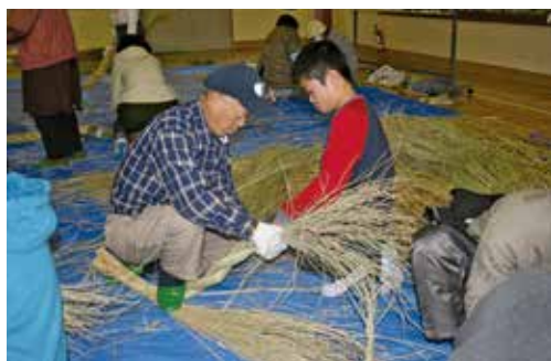
しめ縄作りの様子

12月16日、南条小学校体育館で5年生を対象に、しめ縄と正月リース作りをしました。地区社協の方々も毎年の事業なので、腕前はプロ級！子供達も楽しみにしていたしめ縄作り。みんなとても上手にできました。