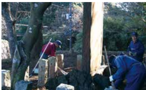
安塚忠徳碑の清掃活動の様子