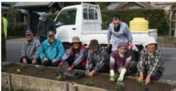
花を植える母子老人クラブの皆さん

町老人クラブ連合会から配布された花の苗を、地区の区民館や公共施設等に植えました。