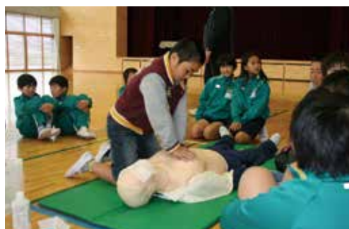
心肺蘇生法の練習の様子

11月28日、東陽小学校で5年生を対象に災害ボランティアスクールを開催しました。