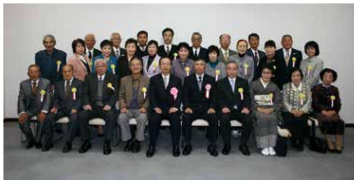
会長表彰並びに感謝状受賞者の皆さん

2月21日、町民会館において、第9回「よこしばひかり福祉のつどい」を開催しました。 第1部の式典では、町の福祉推進に功労のあった方々、社会福祉協議会に対し10万円以上の金品を寄付してくださいました方々や福祉のまちづくり作品入選者の表彰を行いました。 第2部では、社会福祉協議会の活動紹介、光ウィンドオーケストラの演奏、東北震災復興支援を目的としたお楽しみ抽選会があり、東北物産品の抽選に参加者の皆さん一喜一憂しながら楽しんでいました。