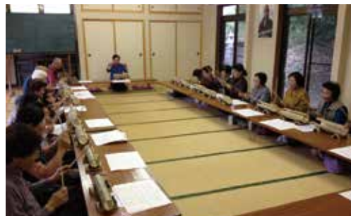
日吉地区サロンの様子

サロン事業実施にかかる消耗品やお茶菓子、会場の使用料などに対し、月額5,000円を上限に助成 ※ただし、予算の範囲内において会長が定める