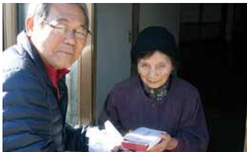
一人暮らし高齢者宅へお弁当のお届け