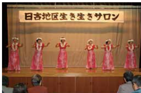
フラダンスの様子

11月30日、町民会館で日吉地区にお住いの70歳以上の方119名参加のもと、日吉地区生き生きサロンが開催されました。フラダンス、映画「ヒロシマ・母たちの祈り」、光ウィンドオーケストラによる演奏が行われました。