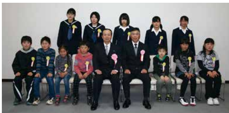
福祉のまちづくり作品入選者の皆さん