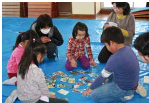
カルタ取りを楽しむ日吉小児童

1月16日 日吉地区、2月2日 大総地区、2月3日 白浜地区 それぞれの地区で小学校低学年児童を対象に、子供の頃遊んだ遊びを伝承する「昔遊び」を開催しました。地区社協運営委員が遊び方を教えると子ども達は口々に「すごい上手」と言っていました。時の経つのも忘れ、子供達と一緒に楽しみました。