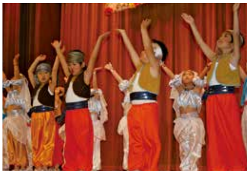
横芝保育所の園児によるお遊戯の様子

12月12日、文化会館で、横芝地区に70才以上の方だけでお住まいの方140名参加のもと、横芝地区ふれあい食事が開催されました。午前中は、フラダンス、よさこいソーラン、舞踊が行われました。また午後からは、横芝保育所の園児によるお遊戯や参加者によるカラオケが行われました。