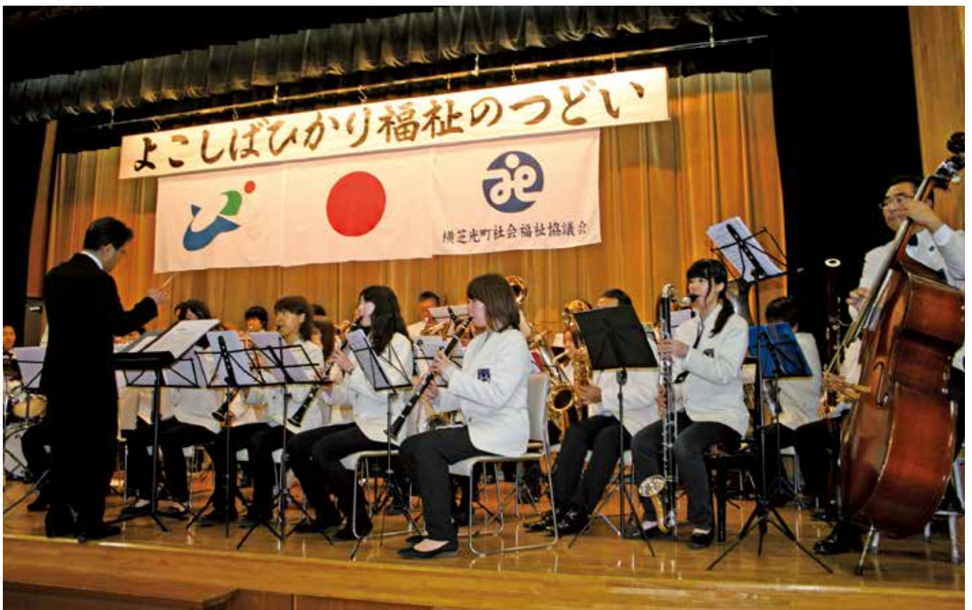
光ウィンドオーケストラによる演奏

— だれもがあらひのままに、その人らしく 地域で暮らすことができる福祉のまちをめざして —