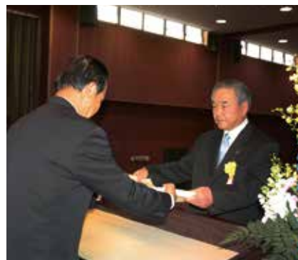
会長表彰を受ける受賞者