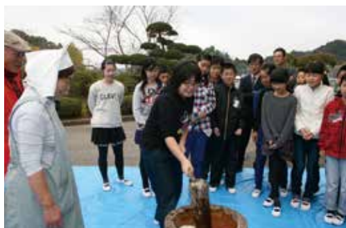
日吉小学校餅つきの様子

11月8日 日吉小学校、1月9日 日吉保育園で餅つきが行われました。餅つき体験をした後、出来上がったお餅をからみ、あんこ、きなこ、雑煮などでいただきました。