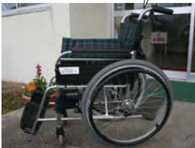
寄贈された車イス

昭和34年度東陽小学校卒業生一同様より、車イスを寄贈していただきました。ありがとうございました。大切に使用させていただきます。