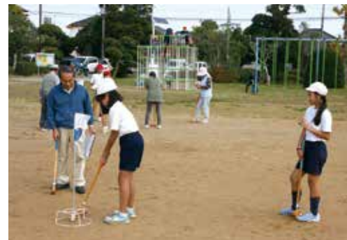
グラウンドゴルフ大会の様子

11月7日、上堺小学校で上堺地区にお住まいの65歳以上の方70名の参加のもと、上堺地区福祉のつどいが開催されました。午前中は4年生と一緒にグラウンドゴルフ大会。午後からは体育館で、上堺小4・5・6年生による金管部の演奏披露の他、地域の方々による舞踊、カラオケ、フラダンス、銭太鼓等の演芸が行われ1日を楽しく過ごしていただきました。